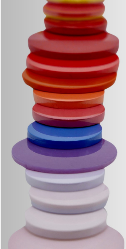
Une large gamme de céramiques colorées disponibles et de métaux hautes performances

Grâce à un temps de frittage court, le procédé Spark Plasma Sintering (SPS) permet de densifier des céramiques à très haute résistance (alumine, zircone, composites, spinelles, ...) sans altérer les nuances sensibles des pigments de couleur utilisés. Il est désormais possible de produire des céramiques aux couleurs inédites : rouge, orange, rose ou violet.