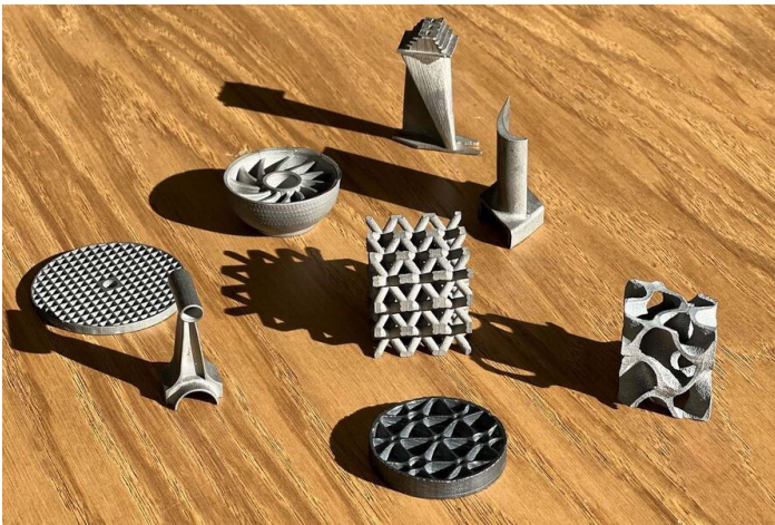
Par l'utilisation du procédé de frittage flash, Norimat produit des pièces sur mesure pour les entreprises de l'aéronautique, de la défense et du luxe.

Pour optimiser les procédés de frittage flash, NORIMAT a développé « Engemini », un outil de simulation numérique unique en son genre. Cet outil permet de simuler avec précision l'évolution thermique et mécanique des pièces pendant le processus de frittage, offrant ainsi aux industriels un gain de temps et d'efficacité considérables.